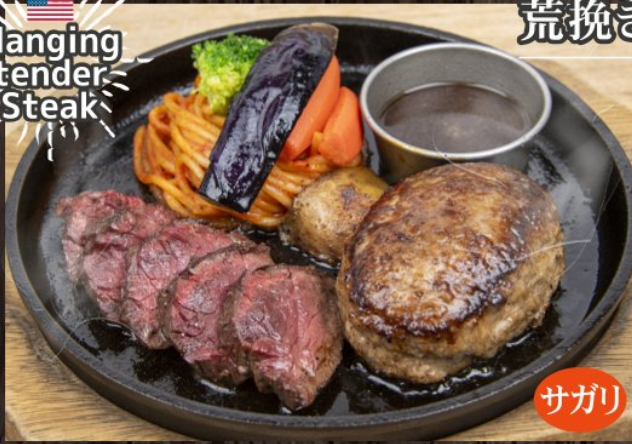
Rough ground Hamburg & Hanging tender Steak