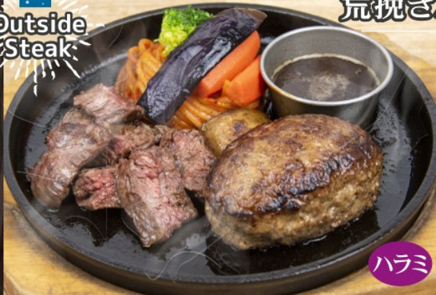
Rough ground Hamburg & Outside Steak