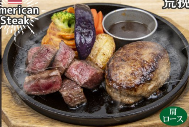
Rough ground Hamburg & American Steak